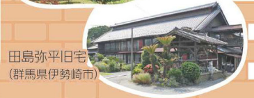
田島弥平旧宅 (群馬県伊勢崎市)