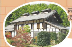
高山社跡 (群馬県藤岡市)